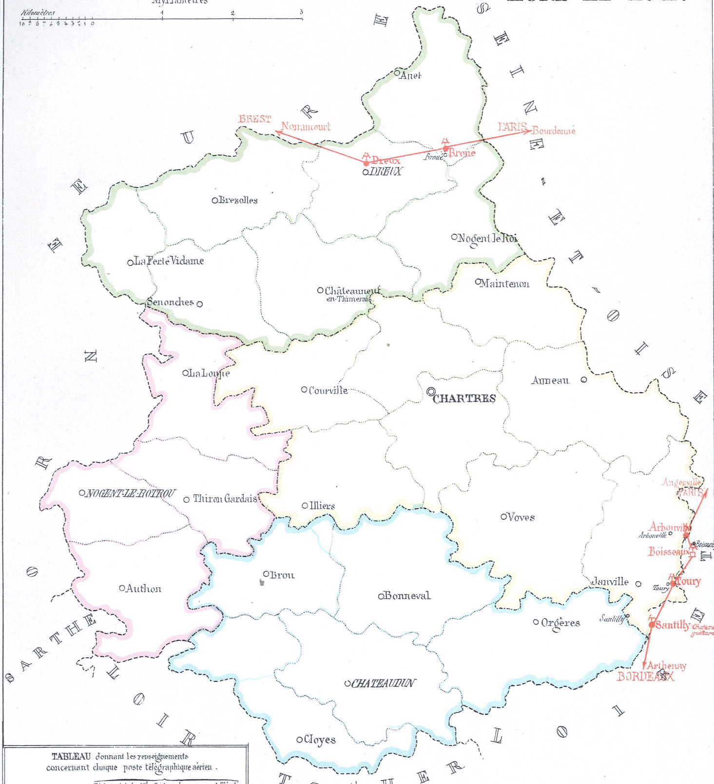
TABLEAU donnant les renseignements concernant chaque poste télégraphique aérien.