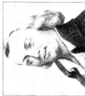
Claude Chappe inventa et mit en œuvre le premier télégraphe optique qui servit d'abord à l'armée.

« L'association du Télégraphe de Chappe du Ban Saint-Martin est connue, elle continuera son œuvre et ajoutera ainsi une borne milliaire à l'histoire de la télégraphie de Claude Chappe. » C'est avec cet esprit optimiste que s'acheva l'assemblée générale de cette année, suivie du traditionnel repas amical.