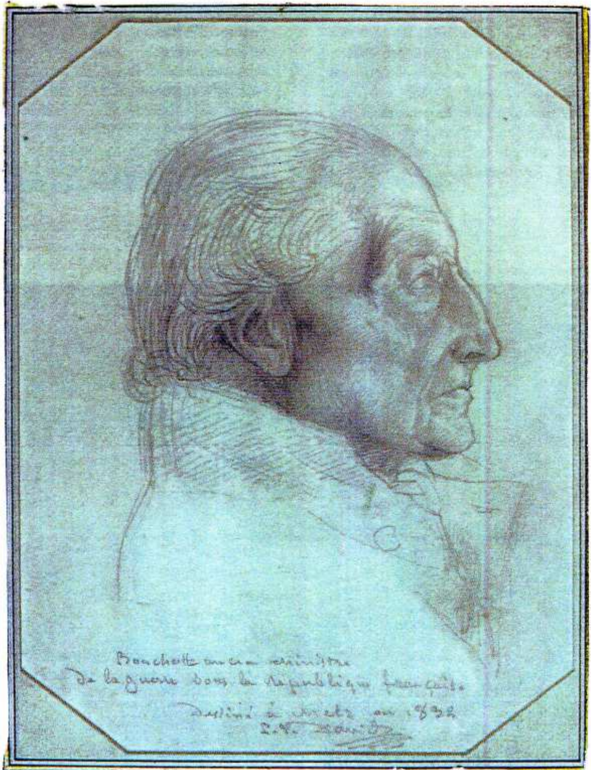
J. B. BOUCHOTTE, ministre de la guerre (1792-1793). Dessin à la mine de plomb par DAVID D'ANGERS (1832)