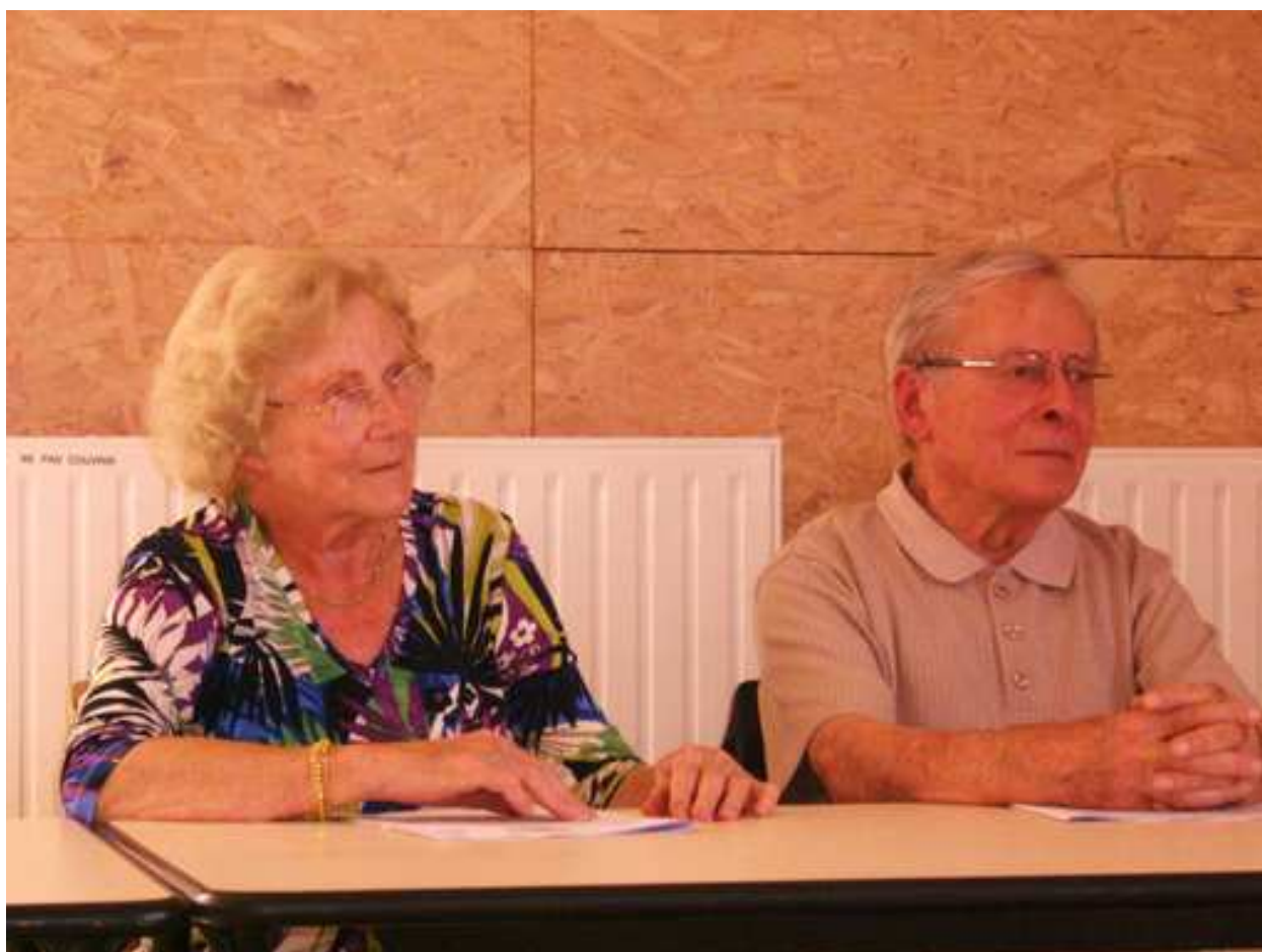
Réunion d'octobre 2009.