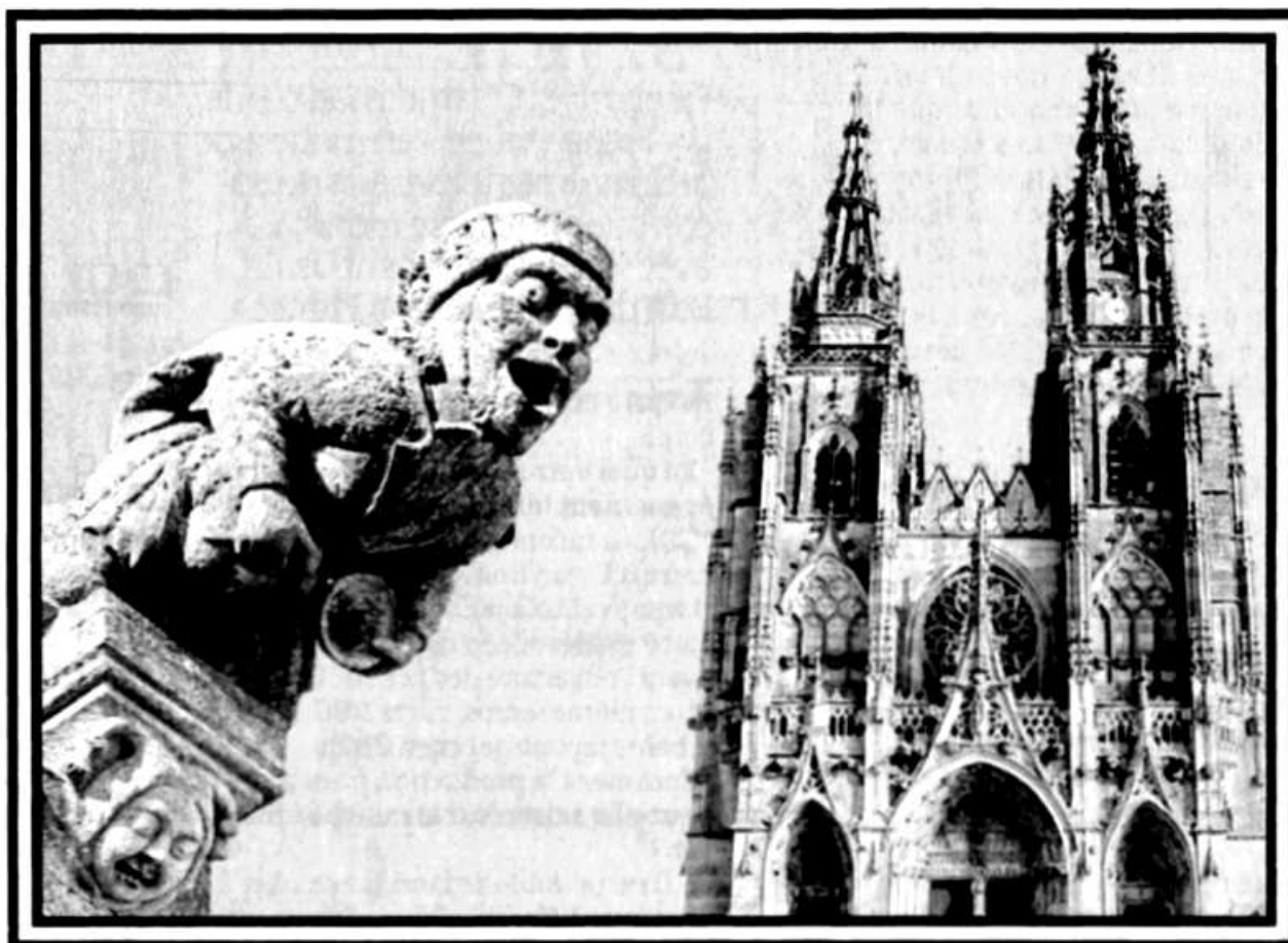
■ Notre-Dame de L'Epine est bâtie sur le modèle de la cathédrale de Reims.

Et quelle fleur, une basilique en pleins champs, longée aujourd'hui par ce qui fut la RN3, qui reliait Paris à Metz via Valmy et Verdun. Mais ce que ne mentionne pas Hugo, c'est que la flèche nord de l'édifice a disparu, rasée en 1798 pour justement installer à sa place un relais télégraphique aérien. Sacrilège, mais quelques années après la Révolution, la décapitation restait dans toutes les têtes. Pour relier Paris à Strasbourg, les frères Chappe avaient obtenu de placer les relais où ils le souhaitaient. Alors, la flèche est tout simplement démontée. En 1812, le mécanisme, emporté par le vent, un autre est acheminé en urgence de Paris. C'est donc une église mutilée, classée après un rapport de Mérimée, qu'admire Hugo. En 1852, les lignes télégraphiques sont abandonnées, mais la commune n'a pas les moyens de restaurer le monument. Seize ans plus tard, Napoléon III verse une subvention personnelle de 50.000 francs pour la restauration quasi à l'identique, avec une flèche plus courte que sa soeur jumelle. Presqu'un miracle. Un autre prodige et l'afflux de dons avaient permis la construction de l'église au début du XVe siècle.