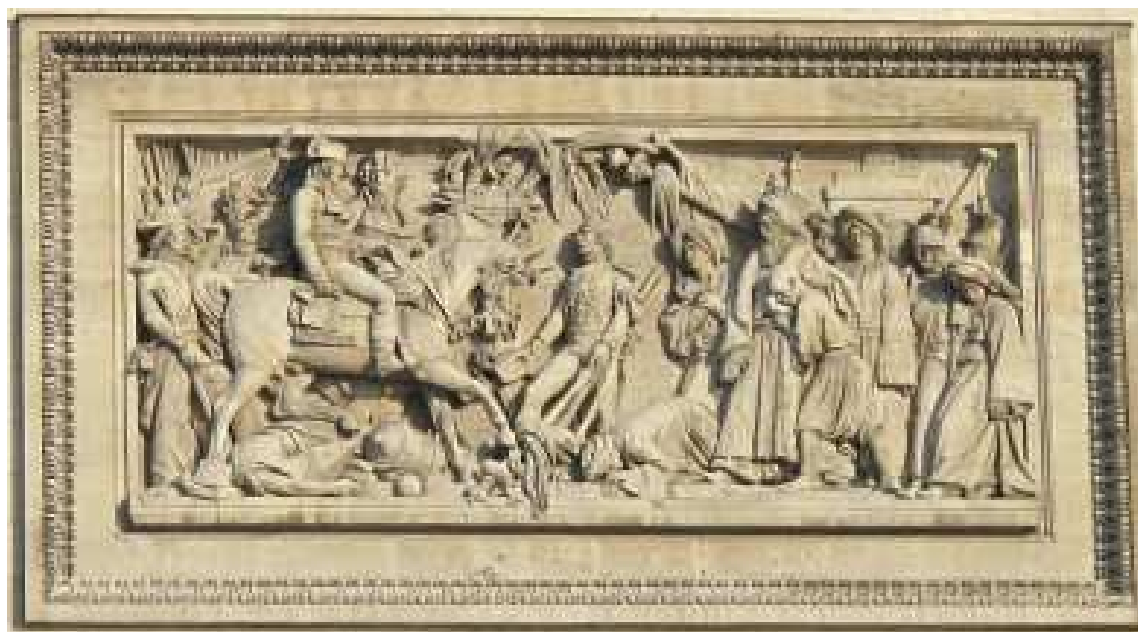
Arc de triomphe de l'Étoile (bas-relief supérieur de gauche) La bataille d'Aboukir par Bernard Seurre