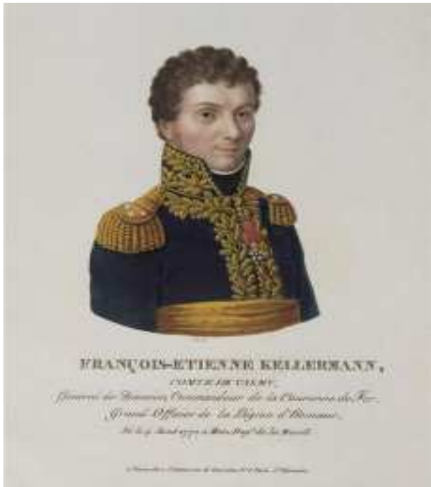
FRANÇOIS-ETIENNE KELLERMANN, COMTE DE VALMY, NÉ LE 4 AOÛT 1770 À METZ.

Affiche bilingue annonçant la victoire d'Aboukir, le 25 juillet 1799. L'information n'a été donné que le 9 octobre 1799 aux Strasbourgeois.