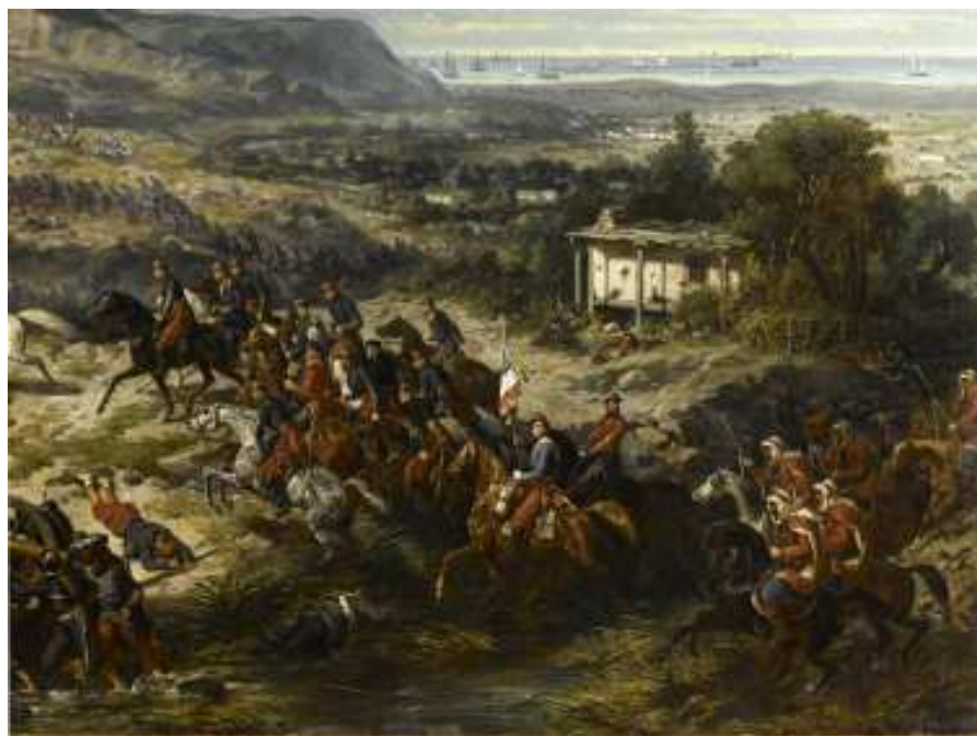
Bataille de l'Alma, 20 septembre 1854

Dépôt légal septembre 2009. ISSN 1637 - 3456 © Directeur de la Publication : Marcel Malevialle. Rédacteur : M. Gocel. Secrétaire : Roland Lutz. Site Internet : www.telegraphe-chappe.eu Webmestre : Bernard Lafont Adresse mail : chappebansaintmartin-rl@hotmail.fr Tél. : 03.87.60.47.57. Le RU-BAN, 3 avenue Henri II, 57050 Le Ban Saint-Martin